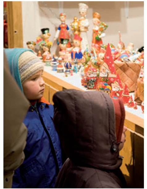
Les Fées d'Auteuil © Jean-Pierre Pouteau

L'association Bibliothèque Braille Enfantine gère une bibliothèque de prêts